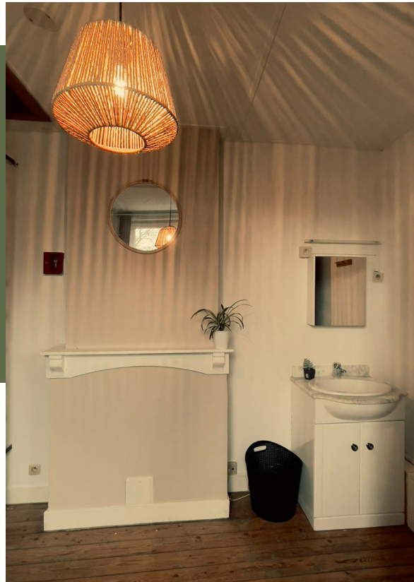
Service attaché à l'AIGS asbl Consortium Ariadné